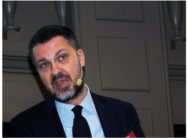
Luca Visentini, ledaren av ETUC.

Att EU saknar både pengar och lagstiftande makt gör att det som återstår är att spela en koordinerande roll. Europafacket uppmanar därför att den enighet som uppstått så snabbt som möjligt följs med ett mer konkret innehåll.