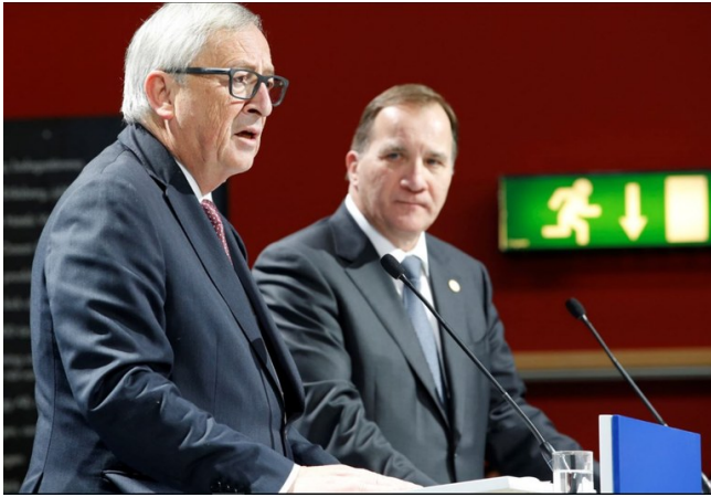
Jean-Claude Juncker, ordförande i EU-kommissionen och Stefan Löfven, Sveriges statsminister.

- Europa har vind i seglen. Politiskt är vi i en mycket bättre situation nu. Nio miljoner nya jobb har skapats. Vi i kommissionen kan förstås inte ta åt oss äran för att det har skett, men jag är säker på att vi skulle fått skulden om nio miljoner jobb hade gått förlorade, sa han.