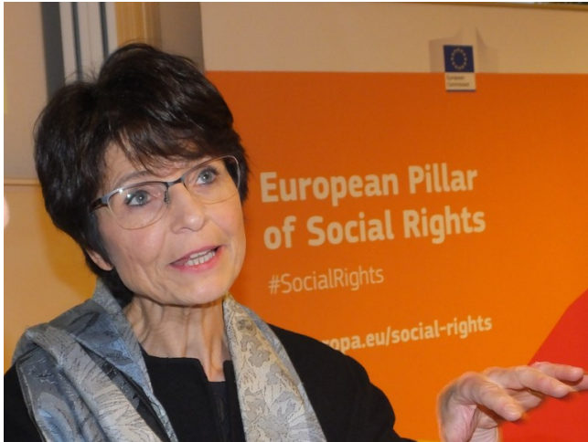
Marianne Thyssen, EU:s kommissionär för sociala frågor.

- President Viktor Orban har kallat den sociala pelaren för ett av EU:s fem angrepp på Ungern. Hur lyckades ni få honom att skriva under? frågade en ungersk journalist Marianne Thyssen, som är EU:s kommissionär för sociala frågor, dagen innan EU-toppmötet.